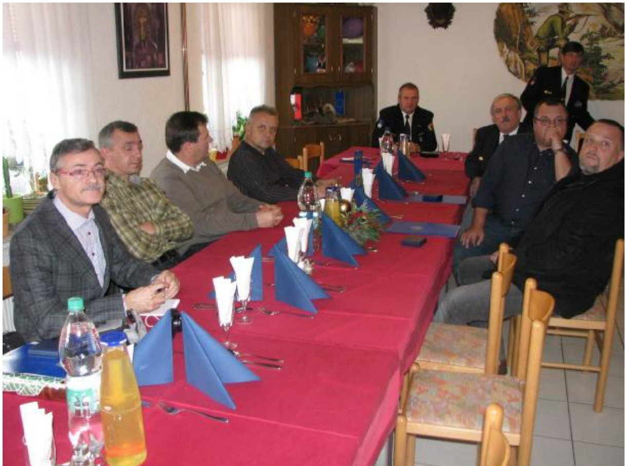
Zbrani na prednovoletnem srečanju.

Sedmi december 2011 je bil torej dan praznovanja, saj smo se člani društva na prednovoletnem srečanju zbrali v gostišču Branka Petriča na Vrholah pri Slovenski Bistrici.