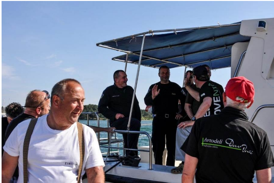
Tudi s hrvaškimi kolegi