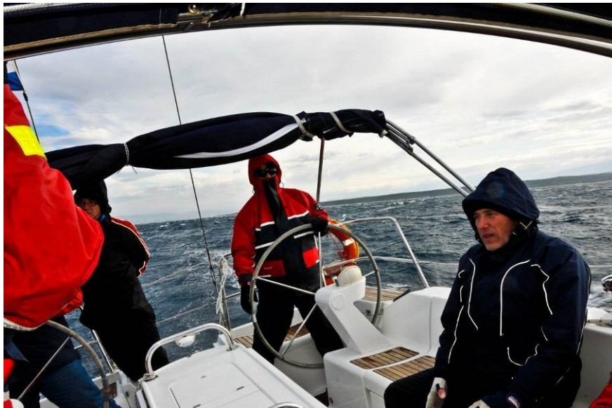
...in po vetru.

Dne 20.4.2013 smo se z jadrnico vmili v matično marino, polni vtisov. Ob ponovnem srečanju s hrvaškimi kolegi smo pripovedovali doživetja iz preteklega tedna in se dogovorili, da se v naslednjem letu ponovno srečamo. Seveda smo hrvaške kolege prijazno povabili pozimi tudi k nam, morda na smučanje z željo, da bi to srečanje postalo tradicionalno.